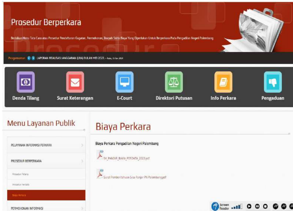
BIAYA PERKLARA PADA WEBSITE