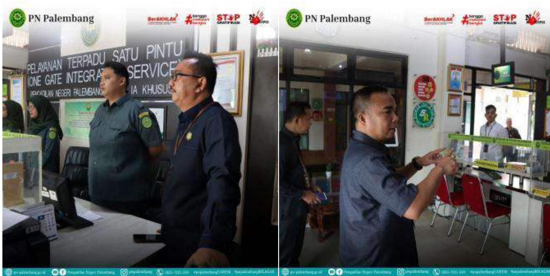
BRIEFING PETUGAS PTSP