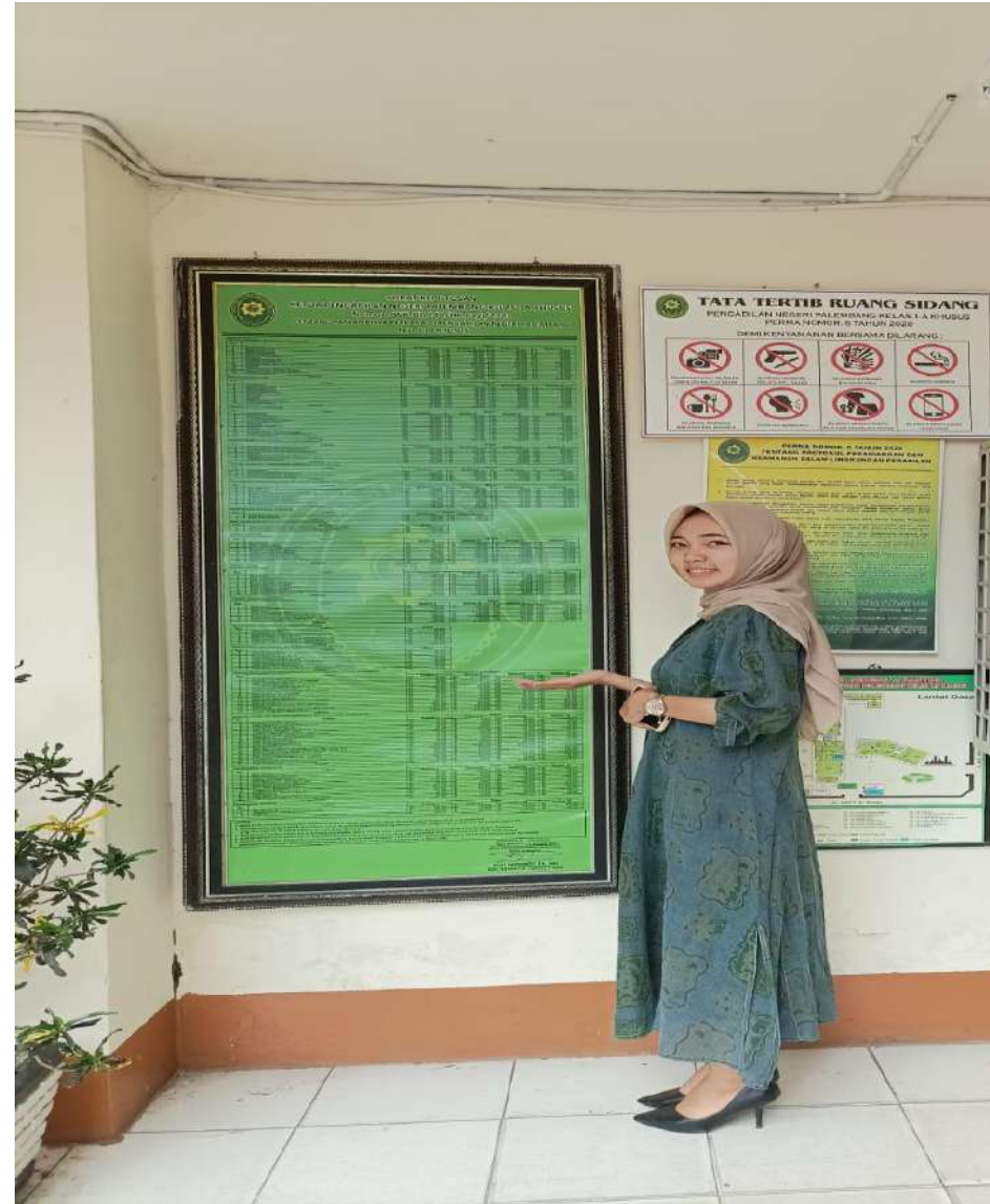
Daftar biaya sesuai radius